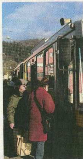
Žilina vrátila bezplatné cestovanie ľuďom nad 70 rokov.

Dôchodcovia môžu žilinskými trolejbusmi a autobusmi cestovať zadarmo, ak majú trvalý pobyt v Žiline a kúpia si za 100 korún mestskú čipovú kartu. Výnimkou je ranná špička počas pracovných dní. „Platí to v ranej špičke od piatej do ôsmej hodiny, kedy je doprava preťažená a primárne slúži na prepravu tých,