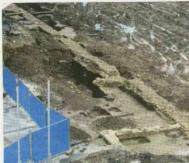
Stavenisko uprostred Trenčína zostalo ľudoprázdne. O to výraznejšie pôsobia starobylé hradby, čo odkryli archeológovia.

Pri trenčianskom Dome armády, kde majú vybudovať nákupné centrum Extrover-